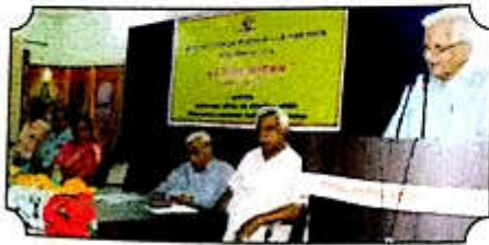
ब्रह्मलीन महन्त दिग्विजयनाथ जी महाराज की 125वीं जयंती की पूर्व संख्या पर पुरातन छात्र परिषद् द्वारा आयोजित समारोह