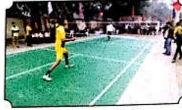
दिग्विजयनाथ स्मृति बैडमिन्टन प्रतियोगिता 2018-19