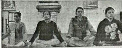
कार्यशाला के दौरान छात्रों ने योग की बारीकियां सीखीं। अमर उजाला