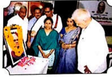
पूर्व प्रधानमंत्री स्व० अटल बिहारी वाजपेयी श्रद्धांजलि समारोह